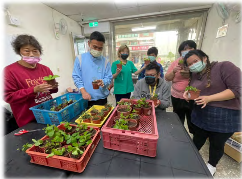
分株薄荷、左手香、芳草萬壽菊

展望未來，農場的永續經營，就必須與時俱進，仍需大家共同努力，在協會積極構思規劃下，增加各項軟硬體設施，創造優質的學習環境，以供日照學員學習。在此謝謝大家，相處愉快。